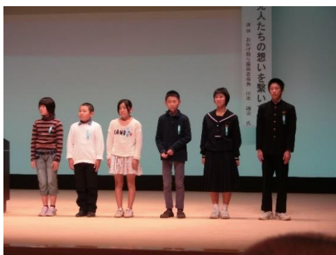
【PTA 作文コンクール表彰 1 名】