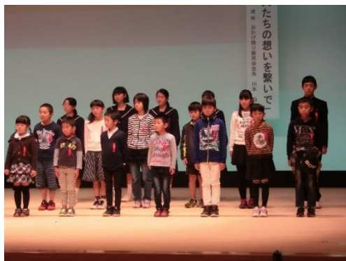
【作文表彰 3 名】