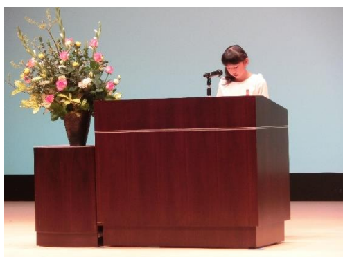
【作文音読 1 名】