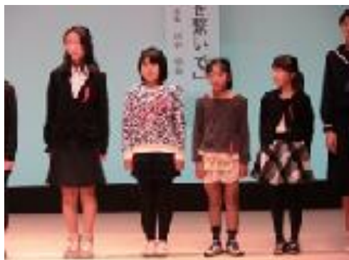
【善行賞表彰 4 名】