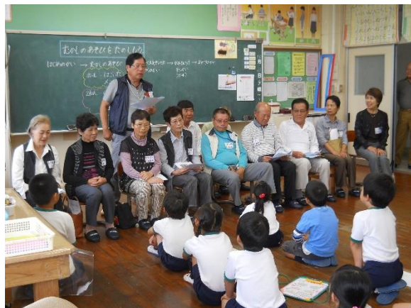
【協力いただいた皆様方と1・2年生】