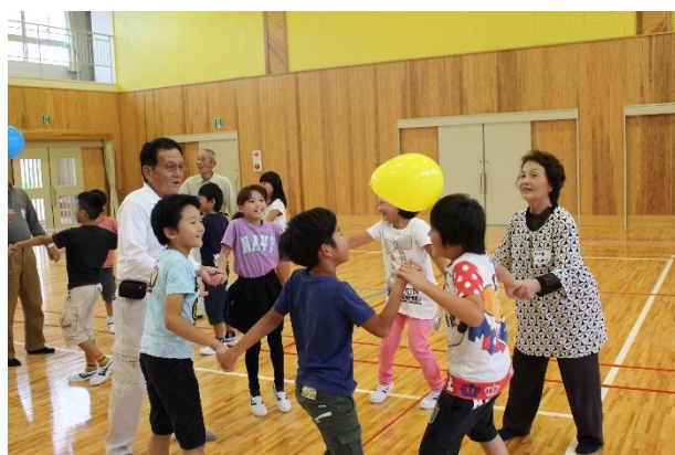
【3・4年生：風船バレー】