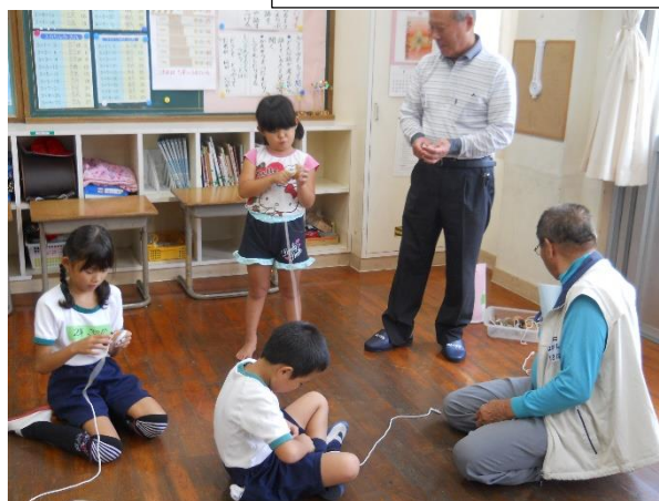
【1・2年生：昔の遊び（コマ回し）】