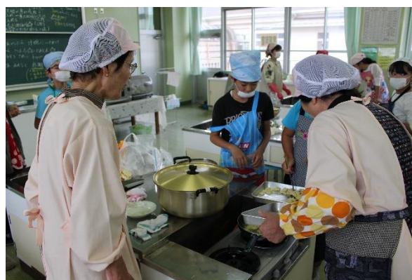
【5・6年生：郷土料理、北斗鍋づくり】