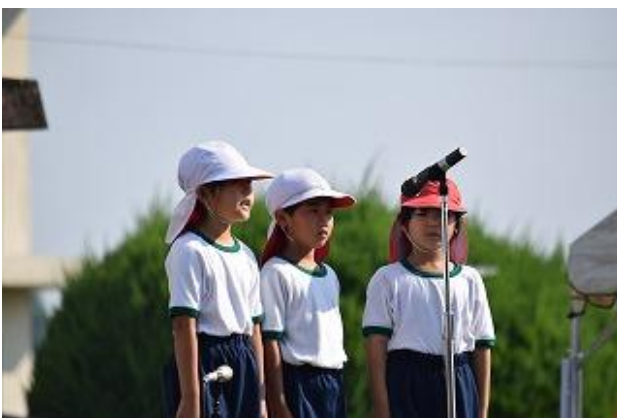
＜1年生 児童代表のことば＞