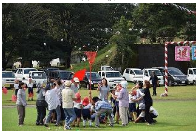
<1・2年生と高齢者玉入れ・赤団>