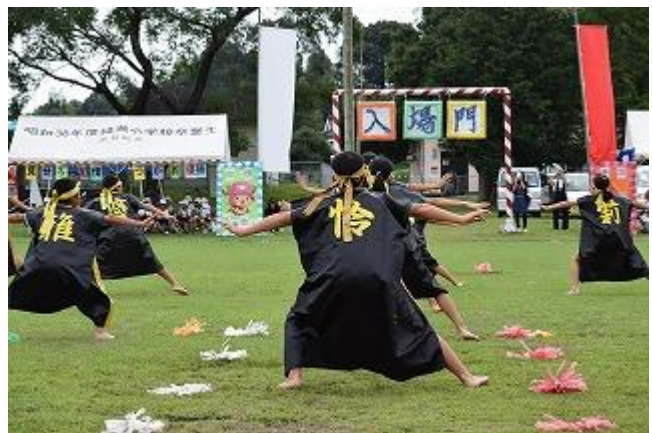
< 5・6年 表現「NAWAZE ソーラン 2017」 >