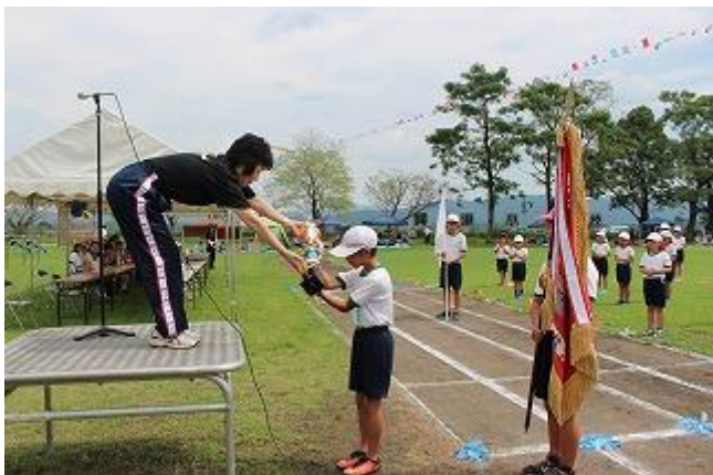
<優勝旗・応援賞トロフィー授与>