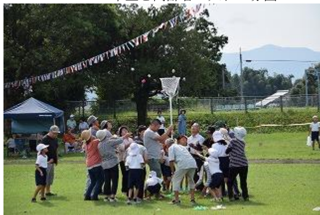
<1・2年生と高齢者玉入れ・白団>