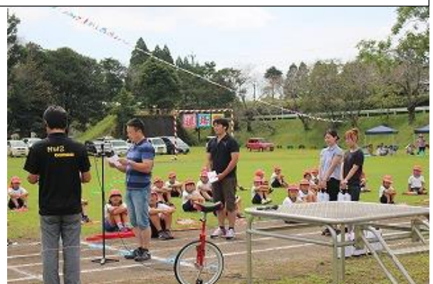
< 厄払い記念式典 >

毎年、母校のために、たくさんのご支援をしてくださる卒業生の皆様方、誠にありがとうございます。