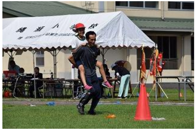
< 6年 親子団技 >