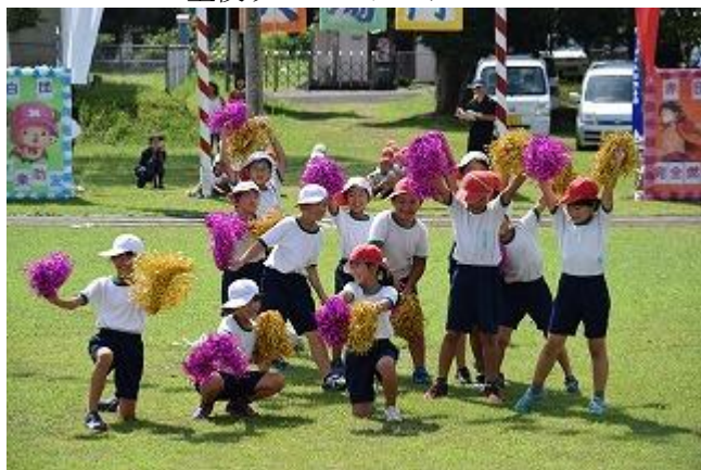
<3・4年 表現 「学園天国」>