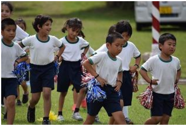
< 1・2年 表現 「ヒーロー」 >