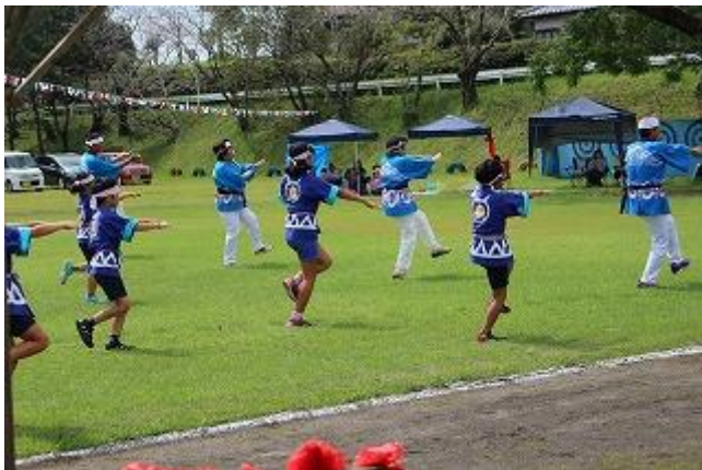
< 奴踊り・保存会の皆様と >