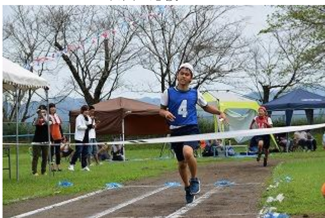
<全校リレー アンカー>