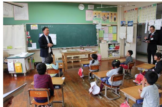
＜ 1年「学級活動」 ＞