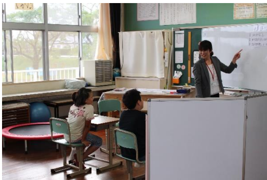
＜ たいよう学級「学級活動」 ＞