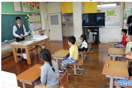
＜ 2年「道徳」 ＞