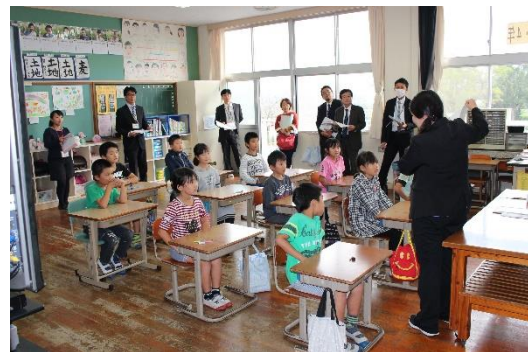
＜ 3・4年「道徳」 ＞