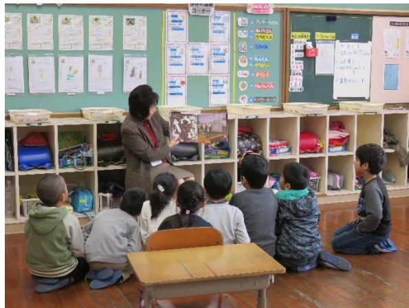
< 2年 >

毎月の「図書館便り」で、図書委員会児童による読み聞かせやすぎのご倶楽部の皆さんによる読み聞かせの様子をお伝えしています。ご存じのこととは思いますが、本校職員も交替で読み聞かせを行っています。どの子どもも目を輝かせて耳を傾けてくれます。テレビやゲーム・スマホから離れて、静かに読書に親しむ時間を、ご家庭でももっていただけるとありがたいです。冬休みもたっぷり読書を！