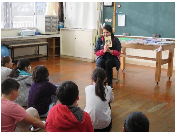
< 5・6年 >