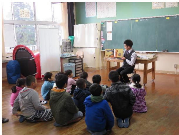
< 3・4年 >