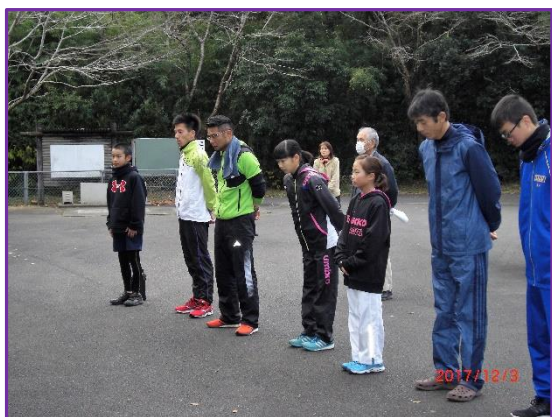
< 活性化センターにて出発式 >