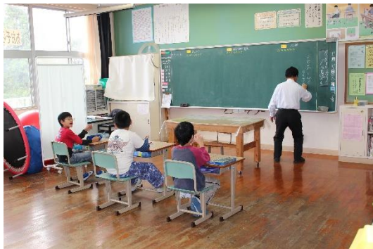
＜ あおぞら学級「学級活動」 ＞