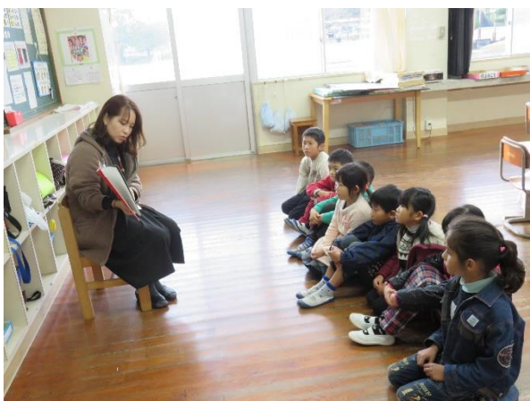
< 1年 >