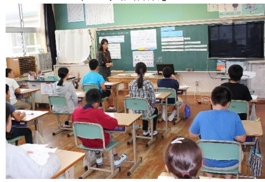
＜ 5・6年「学級活動」 ＞

たくさんの先生方に囲まれながらも、どの学級の子どもたちも姿勢良く真剣に頑張っていました。 先生方の指導もほめていただきました。大役を無事終えて子どもたちも先生方もほっとしました。