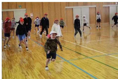
＜大会前に鬼ごっこ！＞

「おはようございます。」や「こんにちは。」は、そのまま同じ言葉を投げ返せばいい言葉です。でも、「おめでとうございます。」⇒「ありがとうございます。」「ありがとうございます。」⇒「どういたしまして。」のように、異なる言葉で返す難しい言い方もあります。子どもたちには、日常生活の中で、場数を踏むことで、自然に口をついて出るくらいになって欲しいと思います。ご家庭のしつけの一つとして、その場その場で「こんな時には、こう言うのよ。」と教えながら言わせていただくとありがたいです。それからもう一つ。「縄瀬小みんなの約束」にある「先生やお客様に会ったときには会釈をします。」の「会釈（えしゃく）」について話しました。歩きながらですが、軽くお辞儀をして通り過ぎることです。立ち止まってあいさつをする「立礼」も大変気持ちのよいものですが、何人かで歩いているときなどには、「会釈」をすると流れがスムーズです。縄瀬小学校に来られたお客様が、さわやかなあいさつや会釈のできる子どもたちに迎えてもらうことで「あー、気持ちがいいなあ。また縄瀬小学校に来たいなあ。」と思ってくださったら、とても嬉しいことです。そのためにはまず、私たち教職員や保護者の皆様、地域の皆様など、子どもを取り巻く大人たちが、礼儀正しい振る舞いや丁寧な言葉遣いの、 よいお手本 を示したいものだと思います。