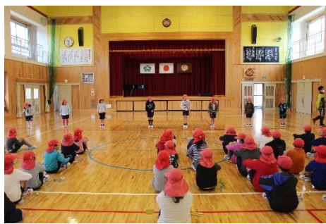
＜1年生も頑張って跳べました。＞

寒い体育館の中で、子どもたちは元気いっぱい駆け回ったり、練習してきた技（わざ）を披露したりすることができました。応援にお願いいただいた保護者の皆様方、ありがとうございました。