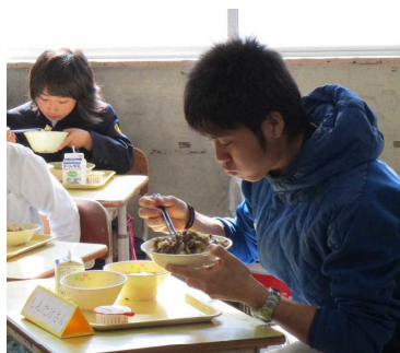
←和牛農家の皆さんとの交流給食のようす。