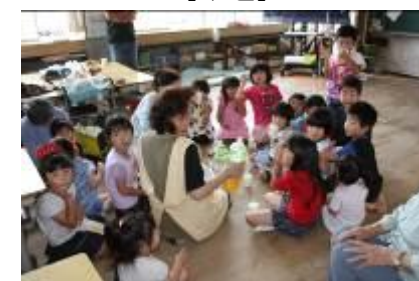
【預かり保育の様子】