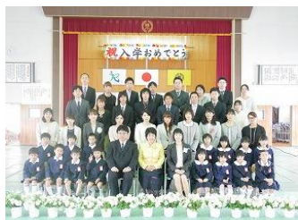
【入学式の記念写真】

12日(水)に、入学式があり15名のかわいい新入生が入学してきました。人の話をよく聞くことができ、とても落ち着いている印象です。体格がいい子供たちも多いので、きっと運動会の練習も大丈夫でしょう。これから、大切に育てていきます。