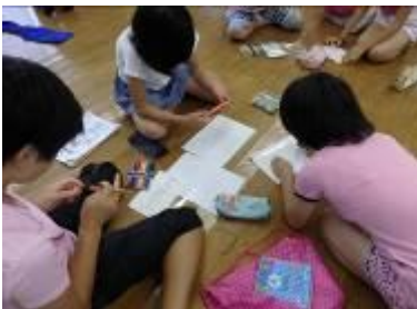
【写真④：プラホビー作りの様子】

写真④は、3日目のプラホビー作りです。自分でデザインを考えます。素敵なお土産になったことでしょう。