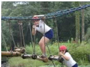
【写真①：フィールドアスレチックの様子】

右の写真①は、1日目の午後から実施されたフィールドアスレチックの様子です。高い所が苦手な児童にとっては、自分の中の弱い心に打ち勝つことが必要になります。