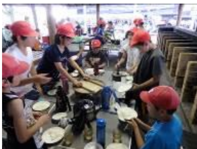
【写真③：カレー作りの様子】

写真③は、2日目の午前中に実施した野外すい飯（カレー作り）です。みんなで協力しながら美味しいカレーが出来上がったようです。