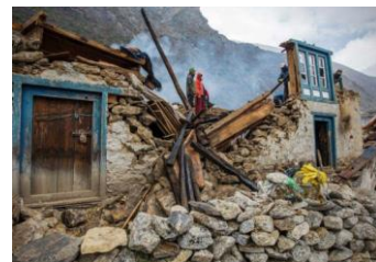
【家屋が倒壊した様子】

今年の4月25日ネパールを中心にM7.8の大地震が発生し、大きな被害が出ました。ニュースや新聞等でも報道されましたので、皆さんもご存知のことと思います。