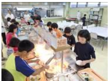
【写真②：食事（バイキング）の様子】

写真②は、食事の様子です。バイキング形式の食事ですが、自分の判断で量を加減しなければなりません。栄養のバランスも大事です。