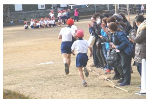
【応援をもらって走る子供】