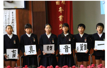
一人一人素晴らしい発表でした。みなさんの将来を楽しみにしています。ずっと応援しています。