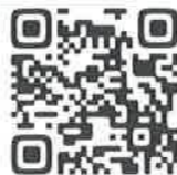
ホームページ QRコード

学校が始まって約1週間、子どもたちは次の目標に向けてがんばっています。まずは運動会です。結団式も終わり、本格的に練習も始まりました。明後日から9月になりますが、残暑はまだまだ厳しいようです。また、コロナ禍での取組になりますが、熱中症も含めて対策を万全にして、練習を行い、当日を迎えたいと考えています。保護者の皆様のご理解・ご協力をよろしくお願いします。