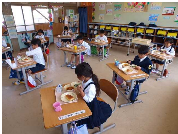
はじめての給食(1年生)

始業式、入学式の子どもたちの様子は立派でした。今日の素晴らしいはじめの一步を、1年間にわたる子どもたちの健やかな成長につなげていくために、本年度は以下のことに重点をおいて教育活動を実施していく予定です。