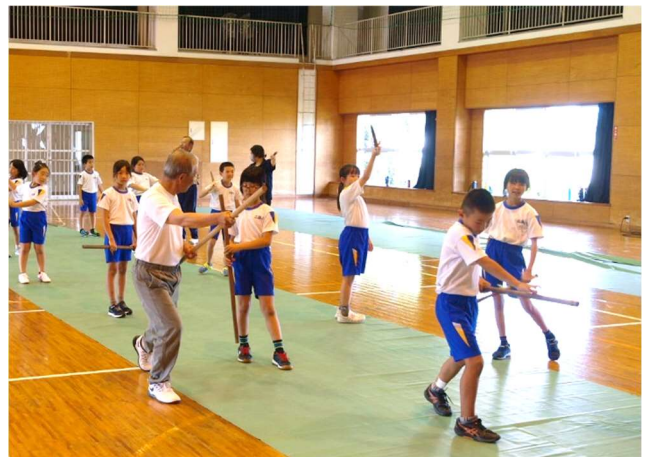
【棒踊りの練習の様子 3～6年】

さて、24日から夏休みがはじまります。有意義な夏休みになるように、夏休みのしおりを元に、各担任から指導を行っております。ご家庭におかれましても、夏季休業中の過ごし方について話し合っていたいただければと思います。