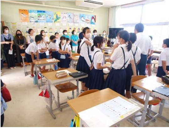
【参観授業の様子 5・6年】