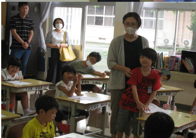
◇2年生:「じぶんのいいところ みんなのいいところ」