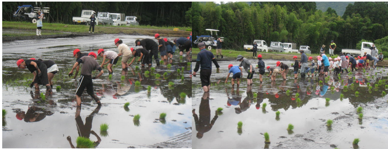
<写真は、3年生の田植えの様子>

途中の稲の成長を観察しながら、10月下旬に「 稲刈り・収穫体験 」を行う予定です。