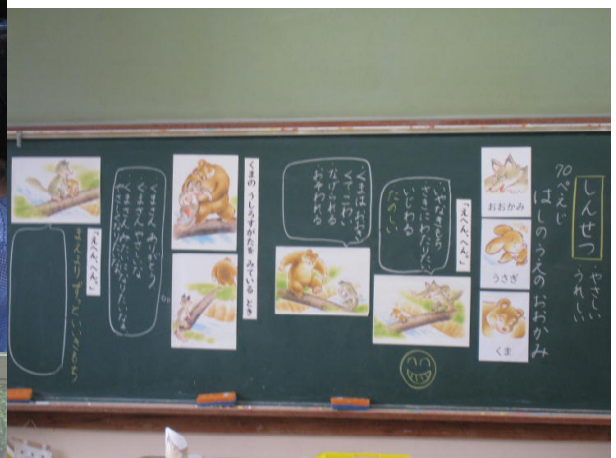
◇1年生:「はしのうえのおおかみ(道徳)」