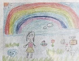
小林市・紙屋小1年 青声 晴音さん(7)