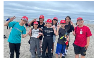
【海辺での集合写真】

野尻小と栗須小と紙屋小の3校合同で実施しました。天気にも恵まれ、有意義な2日間を過ごすことができました。今後の生活に生かしてほしいと思います。