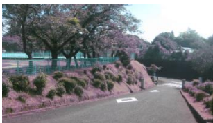
【きれいに整備された学校入口の様子】