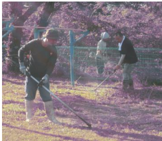
【草刈り作業の様子】

6月1日(土)に実施しました。児童、保護者、職員、地域(一徳会)の皆様あわせて約100名ほどの皆様にお手伝いいただきました。午前7時から約2時間続けて、全員が熱心に作業を行い、学校がとてもきれいになりました。おかげさまで、安全安心な学習環境が整いました。皆様、大変お忙しい中、誠にありがとうございました。