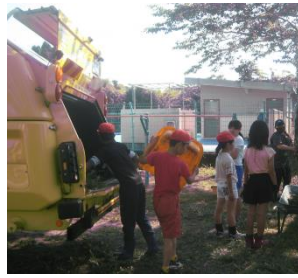
【子ども達のお手伝いの様子】