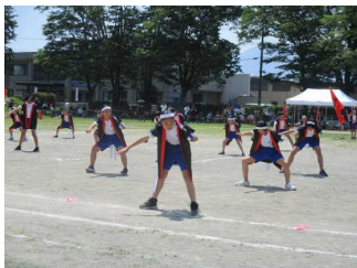
【5・6年生：よさこいソーラン】