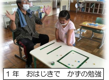
1年 おはじきで かずの勉強