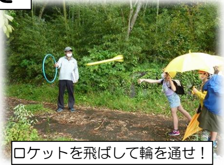
ロケットを飛ばして輪を通せ！