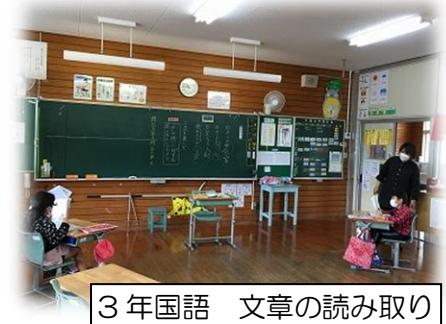
3年国語 文章の読み取り