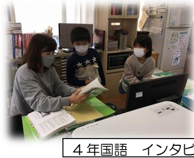
4年国語 インタビュー・メモの取り方