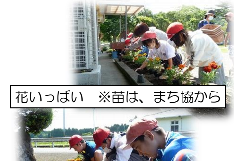
花いっぱい ※苗は、まち協から