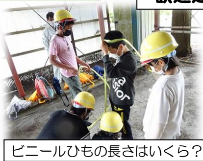
ビニールひもの長さはいくら？