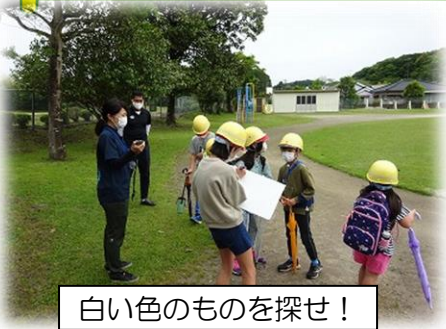
白い色のものを探せ！