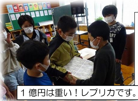
1億円は重い！レプリカです。