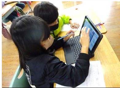
3・4年生 えびの学 えびのの方言をタブレットで調べました。