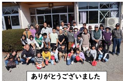
ありがとうございました

11月8日(火)に授業参観、グランドゴルフ大会を行いました。授業参観では、子どもたち一人一人の成長した様子をご覧いただきました。グランドゴルフ大会は、全校児童16名、保護者、高齢者クラブの方々を8チームに分けて運動場で行いました。天気に恵まれ、おうちの方と、おじいちゃんおばあちゃんとお話ししながら、そしてアドバイスをいただきながら、楽しくプレーすることができました。