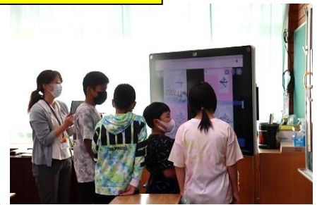
5・6年生 算数 問題を解いてタブレットに書き込み、全員の答えをモニターに映して話し合いました。