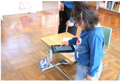
1年生 国語 自分が書き込んだプリントをタブレットで撮影し、先生に送信しました。