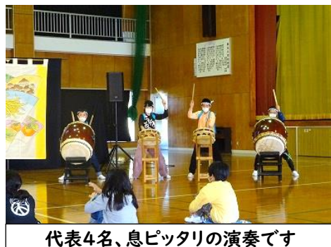
代表4名、息ピッタリの演奏です

11月14日(月)に、鑑賞教室を行いました。今回は民族歌舞団「荒馬座」による日本のお祭りをテーマとした和太鼓と民謡の公演です。体育館中に響く太鼓、笛や鐘の音に体も勝手に動き出すほどでした。代表児童がソーラン節の太鼓を叩き、演者のみなさんが踊る場面もありました。ふだん触れることのない公演に子どもたちも真剣なまなざしで見入っていました。