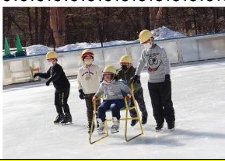
スケート教室 1月11日