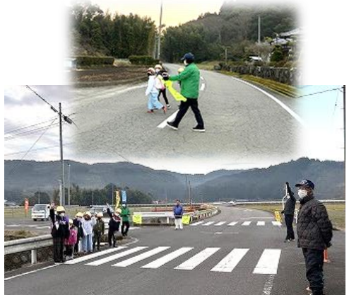
本年も朝の見守りよろしくお願ひします。