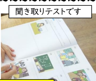
聞き取りテストです