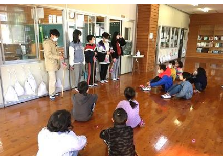
鎌踊りの引継ぎ 6年生が在校生に動きのポイントを教えました。