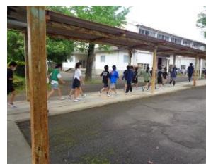
【不審者対応の避難訓練の様子】