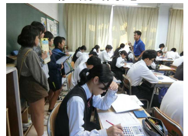
<かがやきハイスクール>