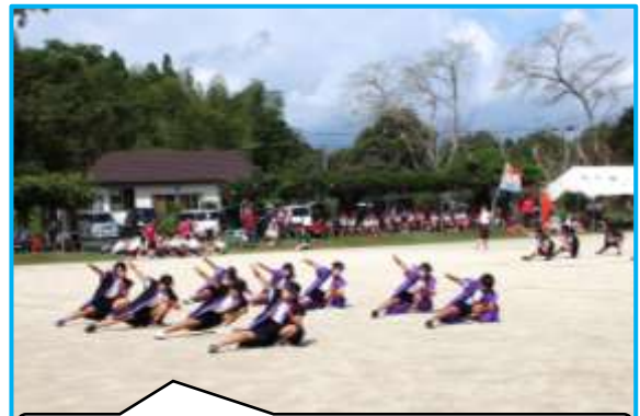
堂々と「都小っ子ソーラン」を披露する5・6年生!