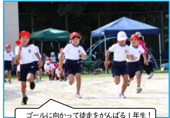
ゴールに向かって徒走をがんばる1年生!

保護者・御家族の皆様には、1家庭2名までの入場制限と問診票の御提出をお願いし、御観覧をいただきました。マスク着用・3密回避のほか、熱中症対策にも御協力いただき、誠にありがとうございました。学校からの様々な御協力依頼に御理解をいただき、子どもたちを温かく見守り御支援いただいたことで、小・中合同運動会が無事に終了いたしました。後片付けにも積極的に御協力いただき、心から感謝申し上げます。