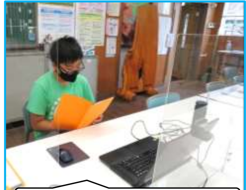
オンラインでの始業式。6年生の発表

小中合同運動会や遠足・修学旅行、都小っ子祭り等の大きな行事が控えている2学期ですが、充実した内容を子どもたちに体験させたいと考えています。また、日常の1時間1時間の授業も大切にしていきたいと考えています。保護者・地域の皆様の2学期の御協力をどうぞよろしくお願ひいたします。