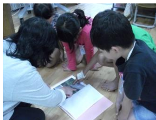
通学路の危険箇所確認