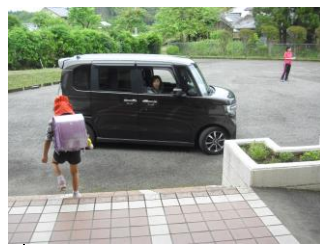
保護者へ引き渡し