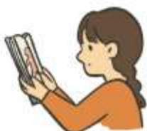
こころ からだ し 心や体を知る