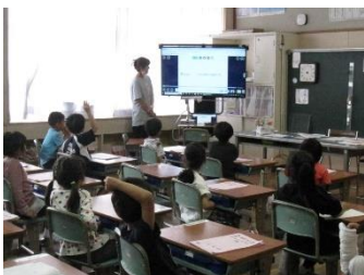
【1年生教室での様子】

タブレットが導入され、子どもたちは自分の力でプレゼンをつくることもできるようになっています。校舎内の教室紹介や給食クイズ、身近な動植物クイズ等を織り交ぜ1年生の目線で作られたプレゼンを各教室で見ながら放送で進行をしていくスタイルが進められ、1年生をもてなす高学年の子どもの優しさが伝わる会となりました。