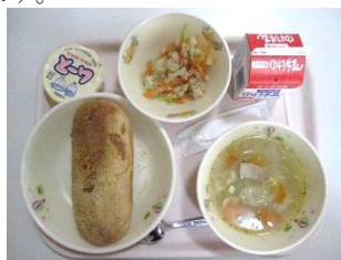
揚げパン 牛乳 ムース コーンスープ ツナサラダ

10月は「富田小のリクエスト献立」でした。右の写真がその日の給食です。「揚げパン」はどの学校でも不動の人気メニューです。デザートも人気です。ゼリーやムース系、クレープ系、フルーツポンチ系等々、子どもたちは喜びます。ご飯の日とパンの日とでは人気メニューが異なります。ご飯の日では、先月のような唐揚げ、チキン南蛮、コロッケ等のメニューが人気です。パンの日では、ラーメンやスパゲティ等の麺類が人気です。今回は、特徴的なパンがリクエストされた感じでした。楽しいメニューの日は子どもたちのテンションも高いですよ!!!