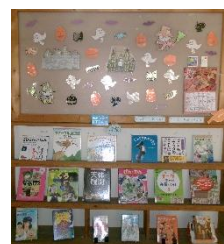
【季節のおすすめコーナー】