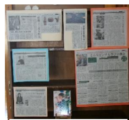
【スクラップコーナー】