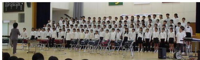
【音楽発表会の様子】

合唱「未来への賛歌」、合奏「風になりたい」の美しい音色が講堂いっぱいに広がり、6年生の姿に富田小の未来を感じる時間になりました。