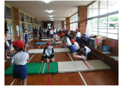
5月17日 体カテスト 上学年が、下学年のお世話をしながらテストを行いました。