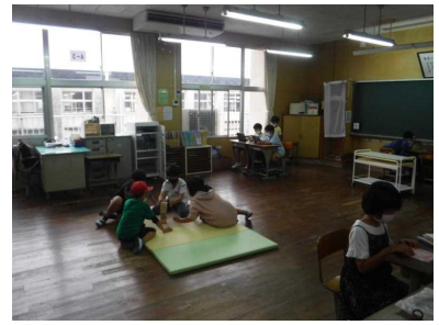
5月13日 遠足（1～4年） 雨天のため、校内遠足を行いました。