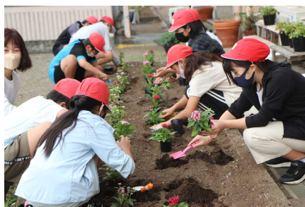
【花壇に夏の花を植え付け】