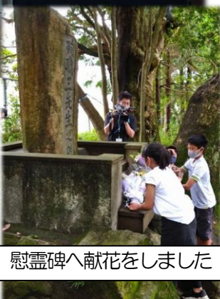
慰霊碑へ献花をしました