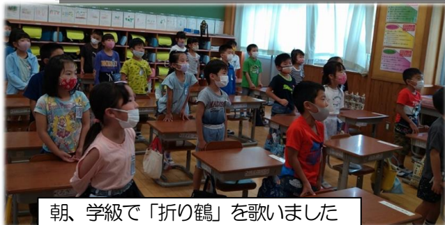
朝、学級で「折り鶴」を歌いました

またみんなが平和で幸せな生活を送るために、私は周りの友達と仲良くしていくことが第一歩だと思います。そのためにも、日頃からやさしい言葉かけをしていこうと思います。