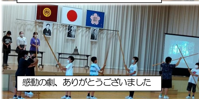
感動の劇、ありがとうございました