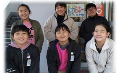
写真撮影（屋外）の時だけマスクを外しています

3学期の「ほめ合い、認め合い、伸び合う学期」の先導役として、「もりあげ隊」が活動しています。先週は、1月の頑張るポイント「あいさつ・朝ボランティア」の“すごい人紹介”を、給食の放送で行いました。なかなか活動について話し合う時間が取れない中ですが、立派に放送できました。今度は2月の取組に向けて準備していきます。では、先日放送した主な内容を紹介します。