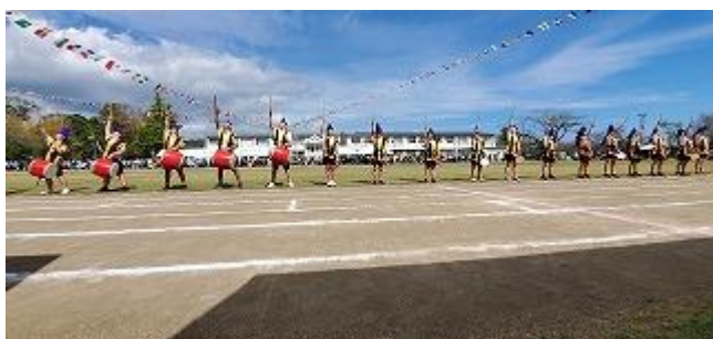
高学年 表現「エイサー」