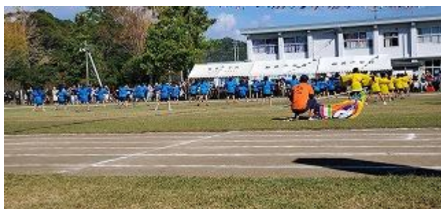
中学年3・4年 表現「ソーラン節」