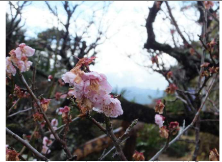
【正面玄関付近の梅の花】

正面玄関付近の梅の花が、満開を過ぎようとしています。大寒、節分そして立春と暦同様季節は、確実に春を迎えつつあります。元々日本では、花と言えば梅を指していたそうです。花見は、梅を見てそれを愛でることであったようです。万葉集でも、梅を詠んだ歌は118首も出てくるそうで、数多く詠まれています。しかし、いつの頃からか桜に、その地位を奪われてしまったようです。厳しい寒さの中、ひっそりと、しかしながらたくましく小さな花を咲かせ、春の訪れを知らせてくれる梅の花。健気(けなげ)という言葉が、浮かんできます。厳しいこの時代、その姿には、何か教えられそして、勇気づけられる気がします。