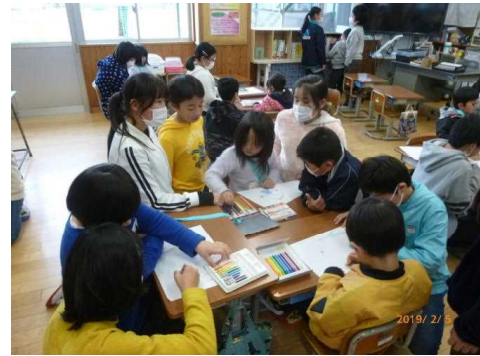
【新入児童と5年生の活動の様子】

新1年生の保護者の皆さんを対象に、入学説明会を行いました。学校生活の様子や家庭での準備等について、担当から説明しました。説明会の間、新入児は体育館で5年生が準備したゲームや遊びのコーナーで1年生と一緒に活動し、楽しく過ごしました。