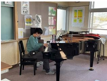
始業式 校歌斉唱 伴奏