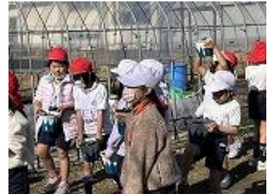
1/10 一人一鉢の準備(1年)