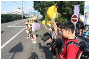
朝のあいさつ運動の様子 (6/24撮影)

雨だけでなく、すごい暑さの毎日ですが、そんな中でも、朝のあいさつ運動を変わらずがんばっている子どもたちです。学校に着いたころには、すでに汗だくになりながらも、子どもたち同士や道行くみなさんへのあさいつをがんばっています。このような地道な行動の積み重ねが、南小学校のいいところとなって根付いてきているのだと思います。これまでに積み重ねてきたものを、今現在も、そしてこれからもさらに積み重ねていくことで、南小学校のいいところがよりよいものとなっていくのだと感じています。