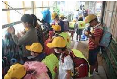
雨の日の朝、1年生のお手伝いをする6年生 (6/11撮影)

1年生の子どもたちは、長期休業などがあったものの、どんどんと学校生活に慣れてきています。ただ、雨の朝などはなかなか大変です。雨合羽や傘の始末など、1年生が右往左往しているのを、上級生がやさしく手伝ってくれています。きっと上級生も同じようにしてもらっていたのでしょね。とてもほほえましい光景です。