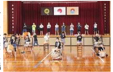
南っ子太鼓の演奏(10/22撮影)

4年生の南っ子太鼓については、1学期から少しずつ練習を重ねてきていました。ただ、これまで発表の場がなかったため