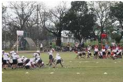
1年生・玉入れの様子

当日、ご覧になった皆さんは気付かれたことと思いますが、子どもたちもいろいろな対策を取りながら競技にのぞんでいました。すべてではありませんが、手袋をして取り組んだ競技がありました。2年生の大玉転がしなどがそうでした。手でつかむなどの接触が多いものに関しては、手袋をするようにしました。また、子どもたちが団のテントにもどって来たときには、消毒も