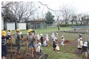
台風の後の畳の型付け作業の様子(9/14撮影)

今回の運動会は、10月なかばの開催となりました。このことに関しては、熱中症対策で昨年度の早い内に日にちを遅くすることが決められていたのです。