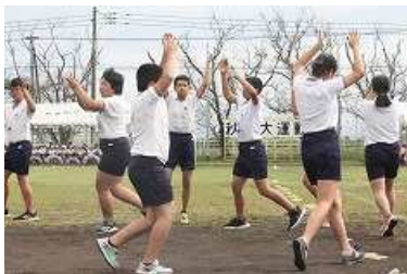
6年生ダンス(表現活動)の様子

どの競技でも子どもたち一人一人、よくがんばりました。中でも6年生のがんばりが際立っていました。競技だけでなく当日まで日々練習を重ねてきた応援など、6年生が中心となり学校全体をよく引っ張ってきてくれました。