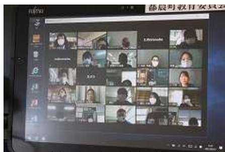
参加した町内の先生方の様子

今回の町教職員研修会は、始めてリモート会議方式で町内の各学校をつないで行われました。まず、教育長のあいさつから始まり、教職員研究論文の表彰と講評、リモートによる各学校をつないでの授業体験、そして各学校からの中継も行われました。各学校では、それぞれの先生たち一人一人がタブレットを用意して研修会に参加しました。リモート授業体験は、各学校をつないで、講師役の先生の問いかけ