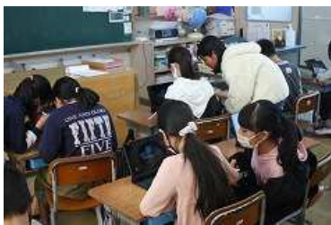
タブレットの初期設定に取り組む児童(4年)

児童1人1台のタブレットの配置については、3年生以上ですでに完了しております。これは、新規に導入したタブレットが、3年以上の児童、1人ずつに割り当てられ、それぞれでID(メールアドレスを兼ねたもの)とパスワードの設定を行い、今は、これから使用していくための準備が終わったところです。1・2年生に関しては、以前から使われていたタブレットを配置し、これらに関してはIDとパスワードの設定を行わずに利用できるようになっています。