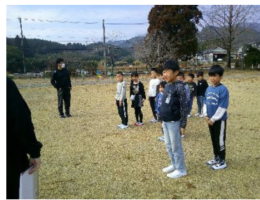
運動場に避難完了！