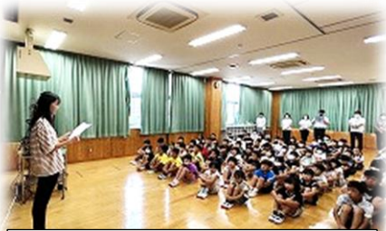
【代表児童の作文発表】