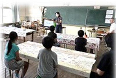
【係の先生方のお話…左：学習面、右：生活面】