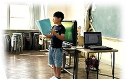
【代表児童の作文発表】