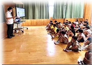
【係の先生方のお話…左：学習面、右：生活面】