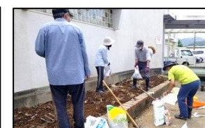
にこにこガーデン作り