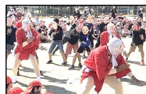
6年 ひょっとこ踊り研究