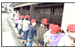
3年 日向の歴史探訪