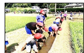
5年 米づくり・販売