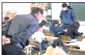
2年 算数花まる先生