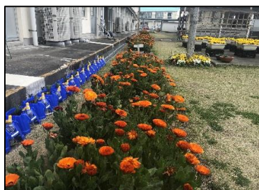
学級園のマリーゴールド