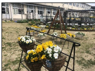
手作りフラワースタンド