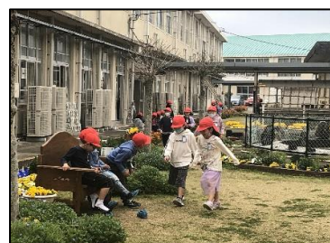
昼休みは、憩いの場