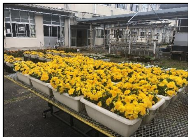
卒業式を待つパンジー