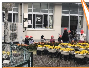
花の周りで楽しくおしゃべり

玄関付近は財小フラワーフェスタのようです。昼休みには子供達が集まり、楽しそうに遊んでいて心が和みます。皆さんもどうぞ見に来てください！すごくきれいですよ。