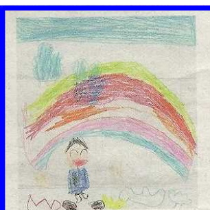
ひらやま 財光寺小1年 本田 航晴君(6)