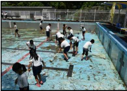
【4・5・6年：プール清掃】

高学年の水泳運動は、「クロール」、「平泳ぎ」及び「安全確保につながる運動」で構成され、続けて長く泳いだり、泳ぐ距離や浮いている時間を伸ばしたり、記録を達成したりする楽しさや喜びを味わうことができるようにします。クロール、平泳ぎとも50mを目指します。