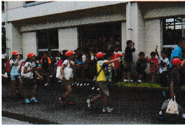
「また来年会いましょう!」

の学年に分かれて給食を取り昼休みまで仲良く交流を行いました。お別れでは来年の再会を約束して見送りました。