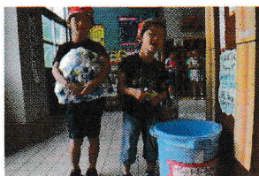
登校後回収場所へ

▶ 細島小では、以前からペットボトルキャップ回収運動に取り組んでいます。ご存知のよう