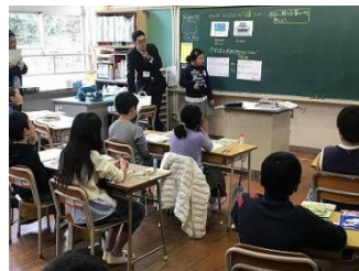
【算数科の研究授業】