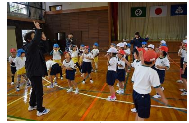
【もうじゅうがりへ行こう】

細島保育所は、来年入学してくる園児も多く、興味をもって学校見学をして回っていました。最後に、校長先生にあいさつをして帰りました。