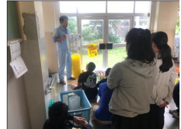
【道具の使い方の説明】

実演を交えて丁寧に教えてくださったこともあり、嫌がってしない子は一人もおらず、自ら便器に手を突っ込んで、真剣に本格的なトイレ清掃に取り組む子どもばかりでした。今回の経験を通して、今まで気付かなかったことに気付いたり、相手を思いやったりする心が育っていけばと期待しています。