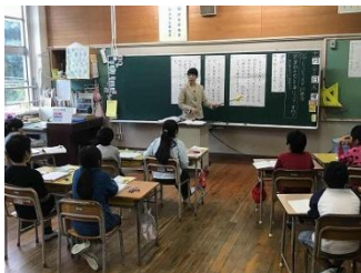
【国語科の研究授業】