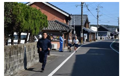
【児童とともに走る校長先生】