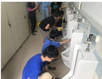
【便器をしっかり磨く児童】