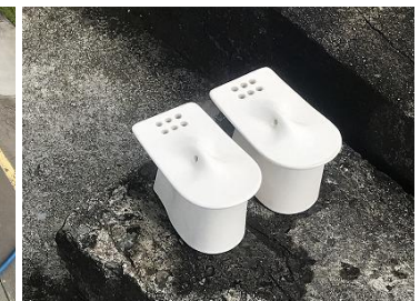
【新品同様の水こし】