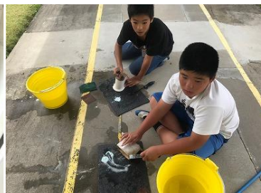
【水こしをきれいにする児童】