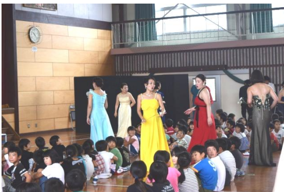
【日知屋小との合同鑑賞教室】