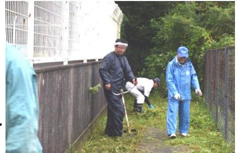
【ふれあい奉仕作業】

10月も、たくさんの行事が計画されていますが、家庭・地域との連携・協力のもと、充実した教育活動が展開できるように、全職員一丸となって取り組んでいきたいと考えております。