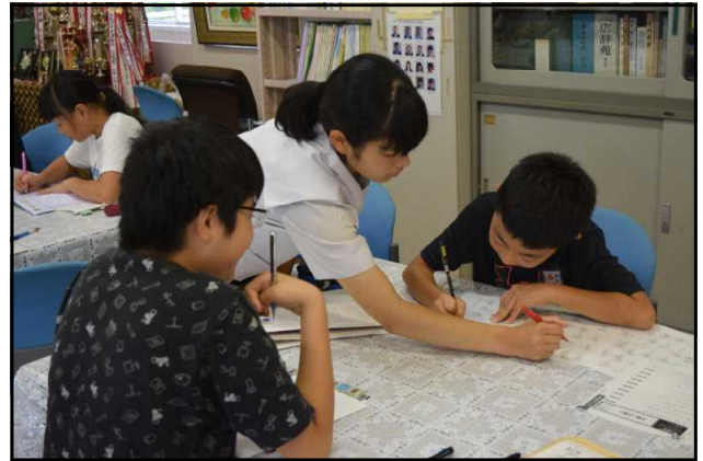
【サマースクールの様子】